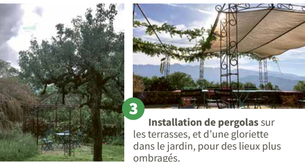
3 Installation de pergolas sur les terrasses, et d'une gloriette dans le jardin, pour des lieux plus ombragés.

Aménagement du potager pour inviter à une fréquentation par les retraitants, création d'un jardin bouquetier pour les fleuristes, installation d'un arrosage avec récupération d'eau.