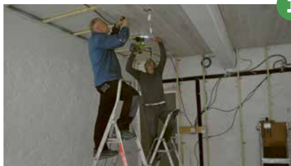
1 Restauration des salles Pinéa et Dent de Crolles dans le bâtiment du Saint-Eynard.