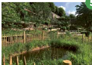
5 Les mares : enjeu majeur en matière de conservation et de développement de la biodiversité. En lien avec la LPO, deux mares ont été creusées à Saint-Hugues au début du printemps. Bientôt, nous vous ferons part des nouvelles espèces, faune et flore, recensées autour de ces plans d'eau.