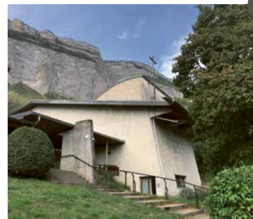
7 Rénovation de la chapelle : nouvelle disposition liturgique et isolation thermique, amélioration de l'acoustique pour une possibilité d'utiliser la chapelle toute l'année dans des conditions de confort, de coût et en cohérence avec la démarche écologique de Saint-Hugues... Un grand et beau projet pour une plus grande utilisation d'une chapelle plus belle, plus accueillante et plus chaleureuse.