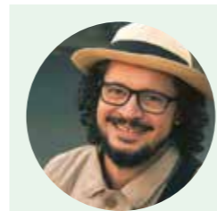
CRÔMENES MACIEL, jésuite brésilien